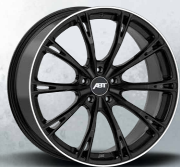
SPORT GR GLOSSY BLACK