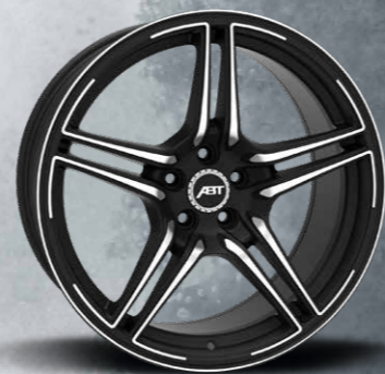
SPORT FR MYSTIC BLACK