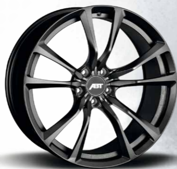
HIGH PERFORMANCE ER-F BLACK MAGIC