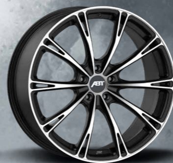
SPORT GR MATT BLACK

Die Angaben zu den Reifendimensionen sind Empfehlungen. Detaillierte und weitere Angaben nach TÜV-Gutachten Ihres Fahrzeugs. Bei manchen Fahrzeugen sind Distanzscheiben erforderlich. Nähere Angaben entnehmen Sie bitte der Preisliste.