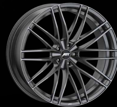
HIGH PERFORMANCE HR DARK SMOKE