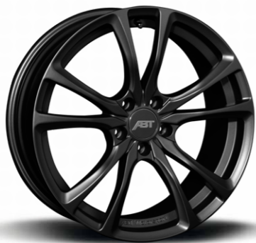
SPORT ER-C MATT BLACK