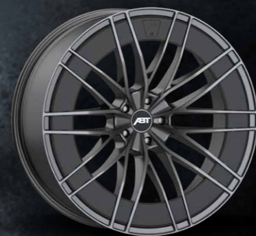
SPORT HR AERORAD