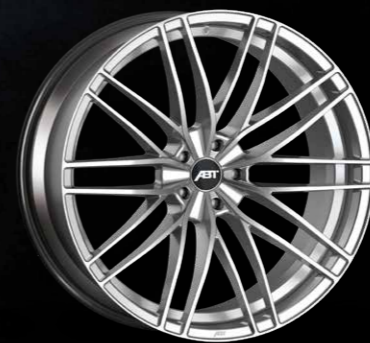
HIGH PERFORMANCE HR SHADOW SILVER