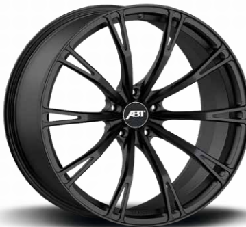
HIGH PERFORMANCE GR BLACK MAGIC