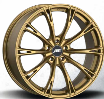
SPORT GR RACING GOLD MATT