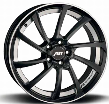
SPORT DR MYSTIC BLACK